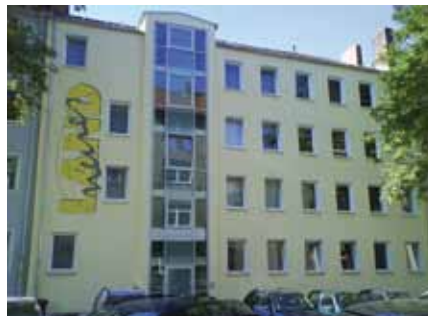
Steintorfeldstr. 11, Hannover

Das Neue Land ist eine von den Sozialleistungsträgern (Deutsche Rentenversicherung, Krankenkassen, Sozialhilfe) anerkannte stationäre Einrichtung zur medizinischen Rehabilitation für drogenabhängige Männer und Frauen (Entwöhnungsbehandlungen). Kostenanträge für die Therapie werden durch unsere oder andere Drogenberatungsstellen gestellt.